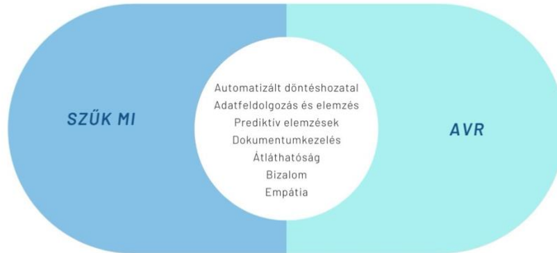
2.ábra – A szűk MI és az AVR kapcsolata 171

Az általános MI és az AVR kapcsolata a technológiai szint fejlettsége okán már jóval szélesebb és komplexebb, mint a szűk MI esetében. Az alábbi ábrán azok a szűk MI-hoz képeset kiemelendő újdonságok láthatóak, amelyek már jelzik, hogy ebben a fázisban már jóval több lehetőség rejlik.